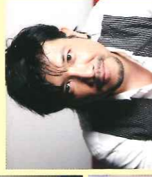
別所 哲也 / 俳優