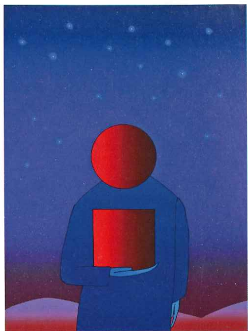
ジャン=ミシェル・フォロン〈円と四角〉1985年 ©Fondation Folon / ADAGP, Paris & JASPAR, Tokyo, 2020 G2255