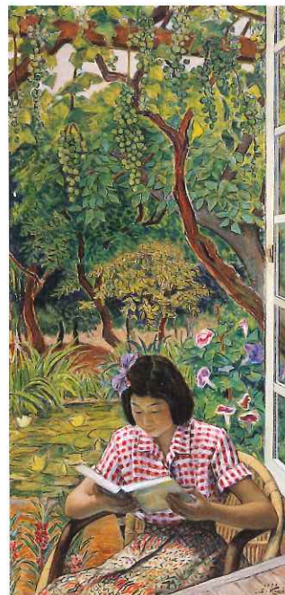
河井清一〈夏の朝〉1959年