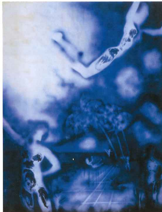
イヴ・クライン〈空気の建築;ANT 119〉1961年