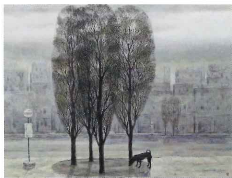
市原義之〈街の朝〉1971年

Universal Museum by The Tokushima Modern Art Museum