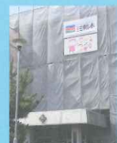
boum × HARD WEAR FACTORY! 御嶽宿店町を会場に期間限定の展覧会を開く「このまはのアートなアイテムをつくり地域を盛り上げる。」