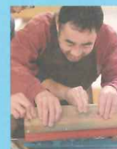
みずほ園 × 有限会社ケイズ 郡上発祥のシルクスクリーン印刷で、郡上ならではのアートなアイテムをつくり地域を盛り上げる。