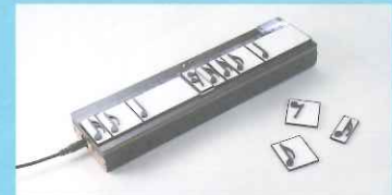
情報科学芸術大学院大学[IAMAS] 特別支援学校との連携でできた事例の紹介。写真は教材として開発された「音符カードプレーヤー」