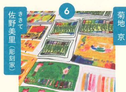
写真:みちか個展 あしたもがんばれます。