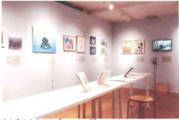
やわらかな土から《レコメン堂》2019年