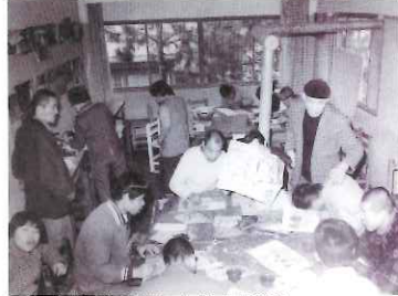
みずのき絵画教室