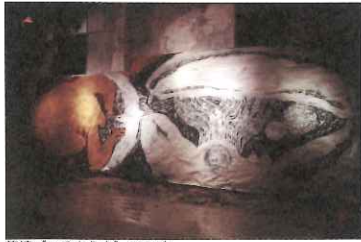
突進《いろどり山》2021年