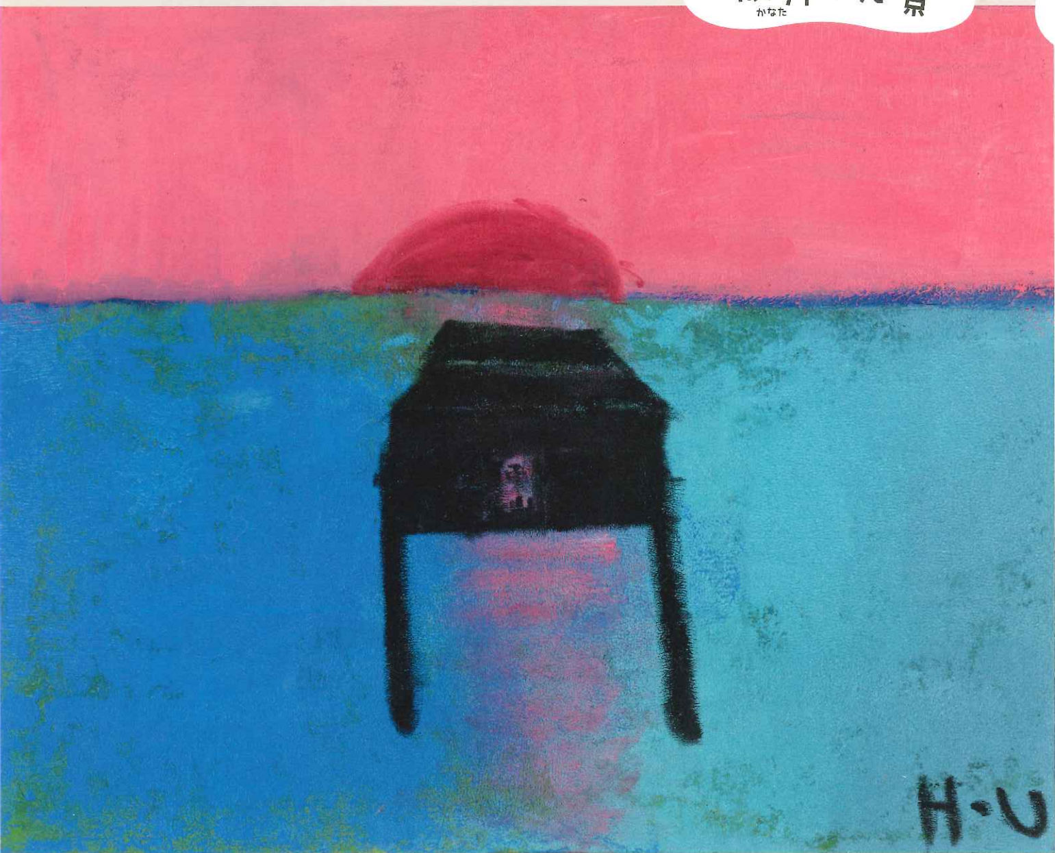
「ピアノ」油彩・キャンバス:宇仁英宏(アトリエ・ウーフ所属/京都)