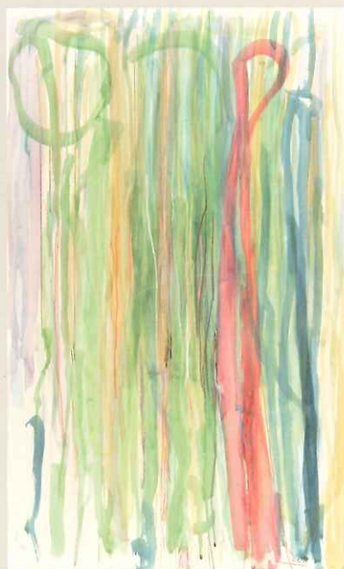
■「La Tour Eiffel」コンテパステル、 透明水彩、紙、パネル 澤井玲衣子 (たんぼぼの家アート センターHANA/奈良)