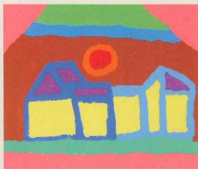
■「港水無水」アクリル、ベニア板 吉川明広 (アートセンター画楽/高知)

※「エイブル・アート展」は障がいのある人が「生」の証として生み出した作品を「可能性(able=エイブル)の芸術」として紹介する展覧会です。