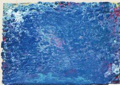
■「中央線」アクリル、パネル 大久保潤 (メーブルかれん/神奈川)