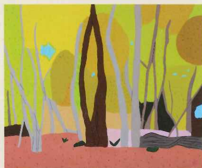
■「関谷の紅葉」アクリル、イラストボード 福島由輝也 (栃木)