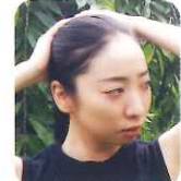
森山真由子 (ダンサー)