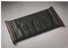
『群書類従』版木 ©大塚敬太+福口俊太

江戸時代の盲人の学者、堀保己一(1746-1821)は、日本の歴史・文化を後世に残すため、666冊の叢書『群書類従』を40年かけて編纂・刊行しました。使用した版木17,224枚は増保己一史料館(東京)に保存され、重要文化財指定を受けています。今回は現代につながる「共生」の視点から、そのおどろきの業績を見直します。同時開催で、現代美術家・宮永愛子による府立図書館の歴史によりそう展示も実施します。