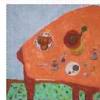
上: ガブリエ・バロント イメージ写真 下: ジダーノフ・アリーナ 作品写真