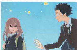
『聲の形』©大今良時・講談社/映画聲の形製作委員会

聴覚障害を持った少女の生を描いた『聲の形』(2016年/第20回文化庁メディア芸術祭アニメーション部門優秀賞)と、聴覚障害の子どもを持つ家族の苦闘と希望を描いた『どんぐりの家』(1997年/第1回文化庁メディア芸術祭アニメーション部門優秀賞)を、聴覚障害者と一緒に鑑賞できる日本語字幕付きのユニバーサル形式で上映します。