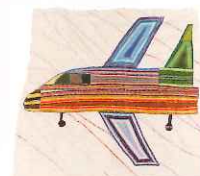
松原日光(軽飛行機)糸、布