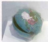
竹村京(修復された地球儀の貯金箱)2000年～現在、作家蔵

写真やドローイングの上に刺繍を施した布を重ねたインスタレーションや、壊れた日用品を布で包んで刺繍する「修復シリーズ」を発表するアーティスト、竹村京による展示とワークショップを行います。作品にふれることで、縫い留められた誰かの大切なものの記憶に思いをめぐらす機会となるでしょう。