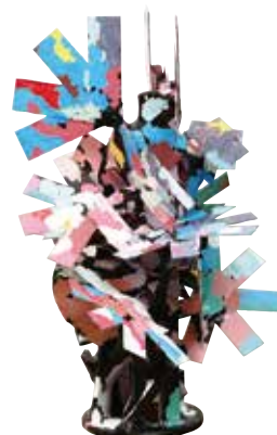
サイボウノシクミ 本田 雅啓