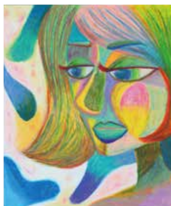
リサ 飯干 真由