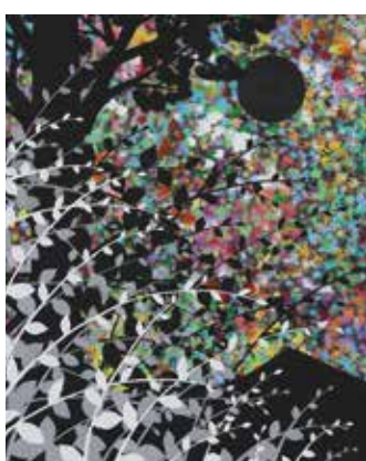
ホシゾラ 本田 雅啓