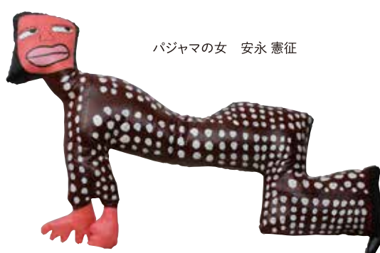
パジャマの女 安永 憲征