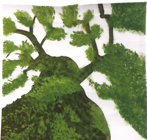
【最優秀賞】大木 / 山本千裕