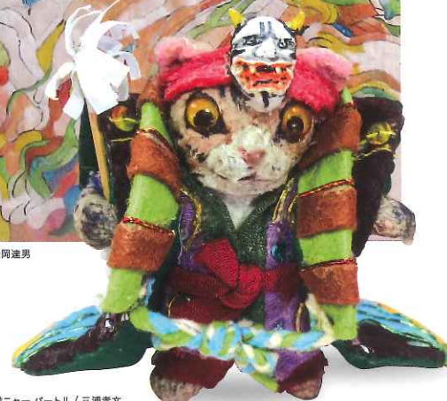
【最優秀賞】鏡ニヤーパーティII / 三浦孝文