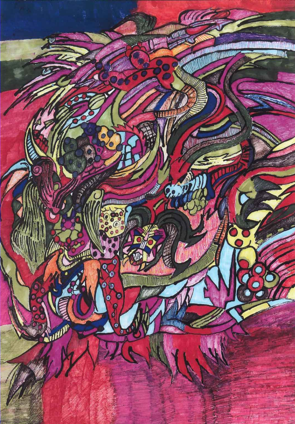
【最優秀賞】空想画 八百万の神々 / 鹿島大祐

※Web作品展は、スマホからは下記のQRコードからアクセスできます。 PCからは、アートベースしまねいろの公式ホームページからご覧いただけます。