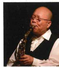
坂田 明 アルトサクソ