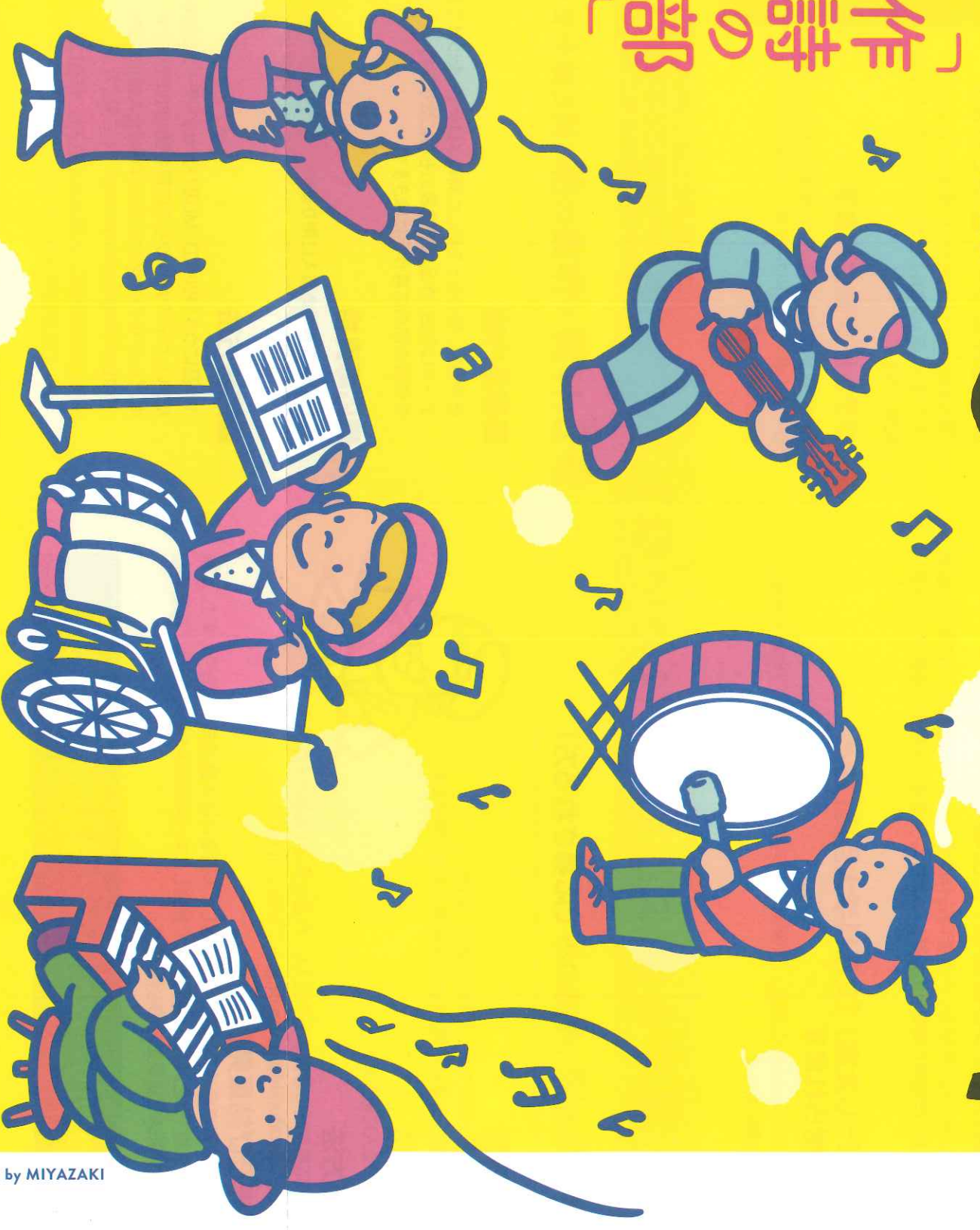
Illustration by MIYAZAKI