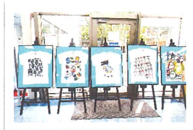
優秀賞 Tシャツ展示

作品募集期間 7月1日(木)～7月23日(金) 作品審査 7月26日(月) 表彰式 8月29日(日) 作品展示期間 8月13日(金)～9月29日(水) 巡回展示 10月12日(火)～24日(日)