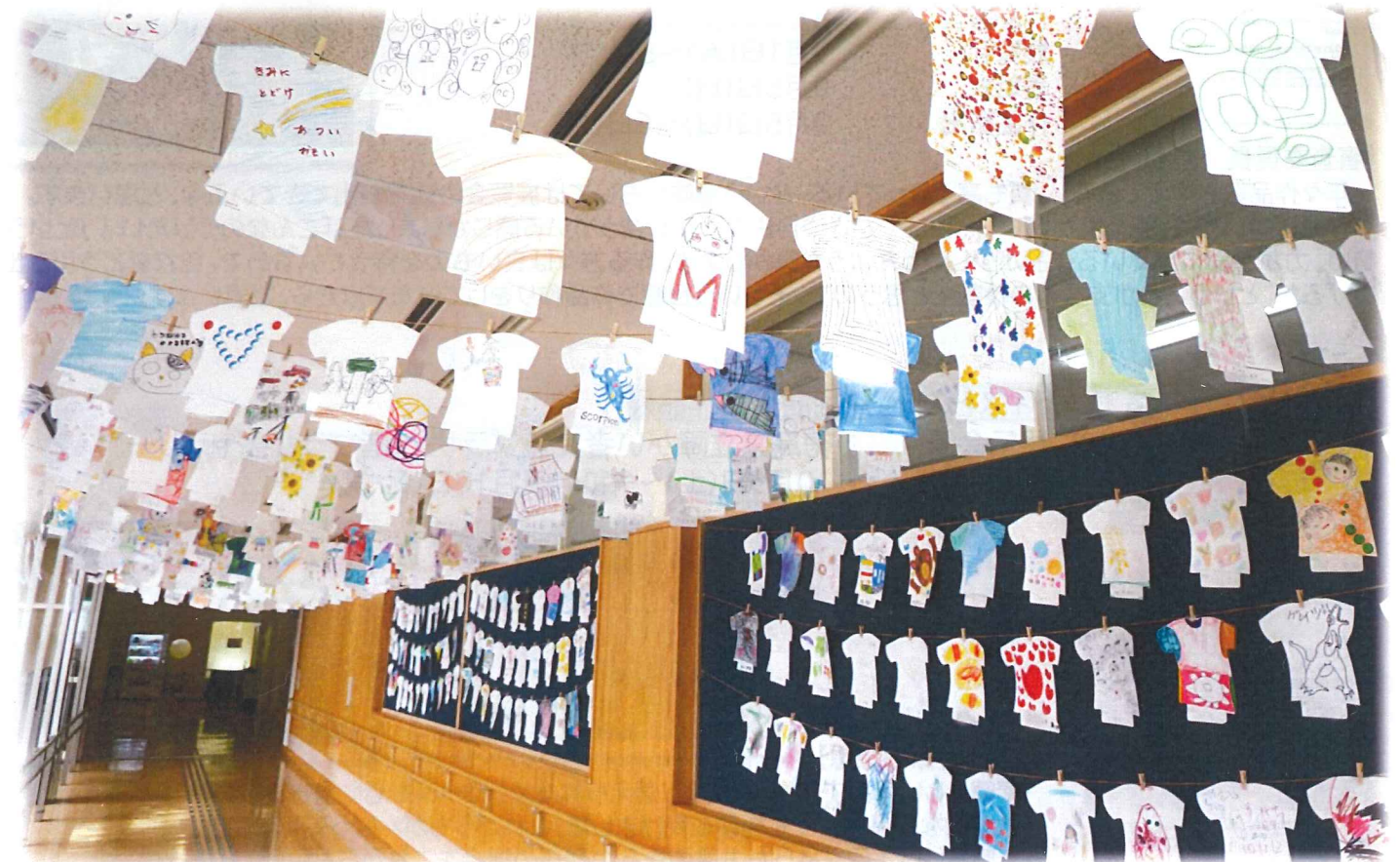
全国公募 夏の空をTシャツで彩ろう「Tシャツデザイン展」展示の様子 徳島県立障がい者交流プラザ2階プラザギャラリー