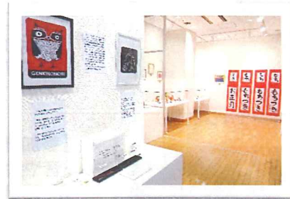
「がんばった！発表会」