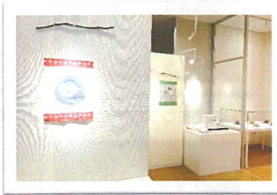
「ふらっと KOKUFU 作品展」