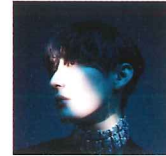
Special Guest 向井太一