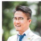
TCFアンバサダー 乙武洋匡