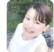
森田かずよ (ダンサー・俳優)