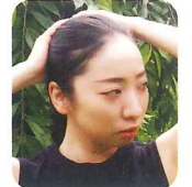
森山真由子 (ダンサー)