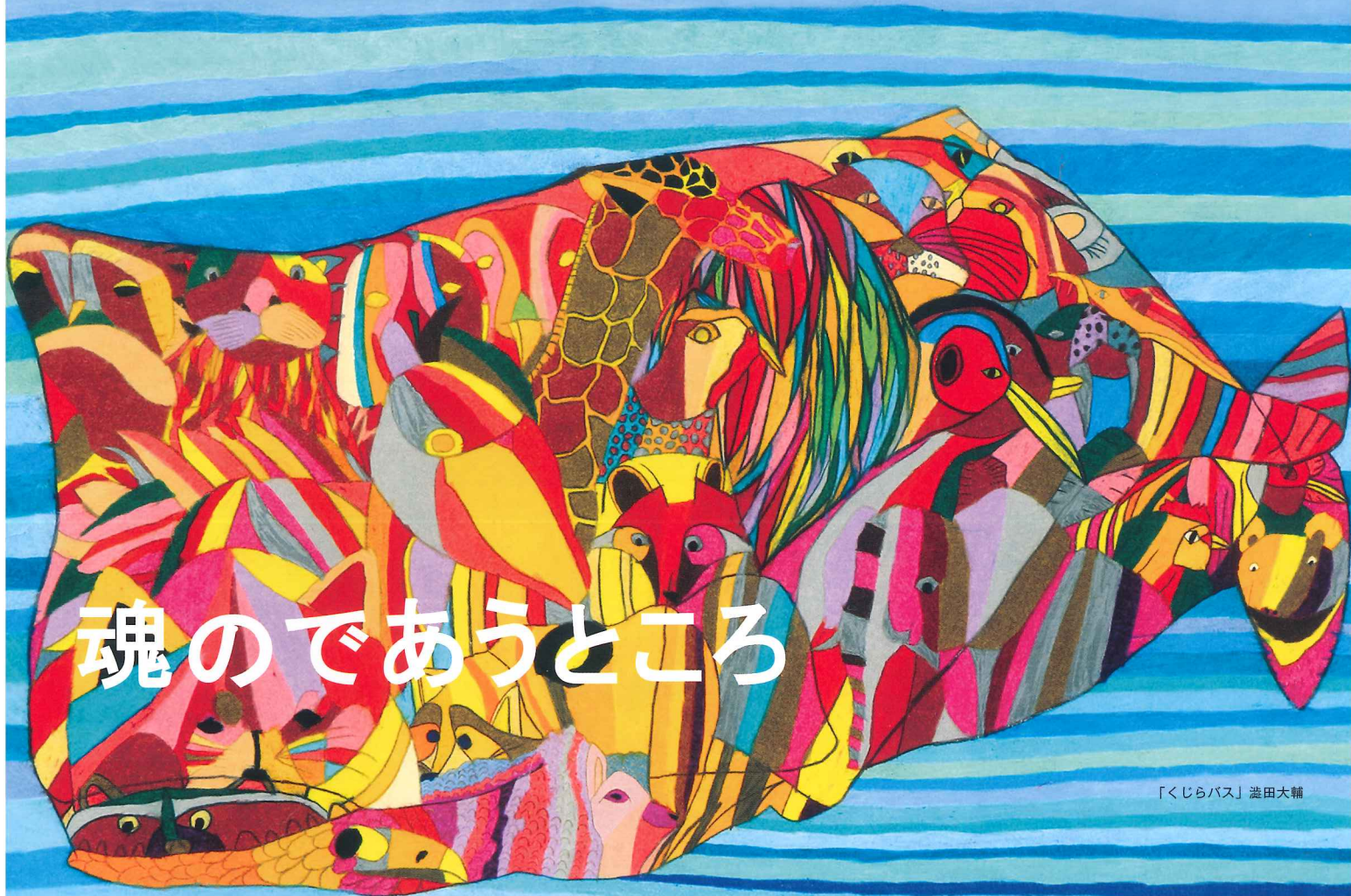
「くじらバス」 澁田大輔