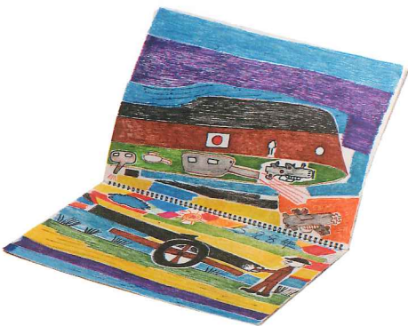
「スケッチブック」 竹内 保晴 | 2020年度 銀賞