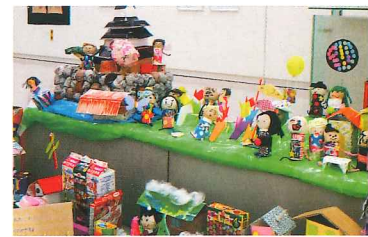
2020年度公開審査会と展示会の様子