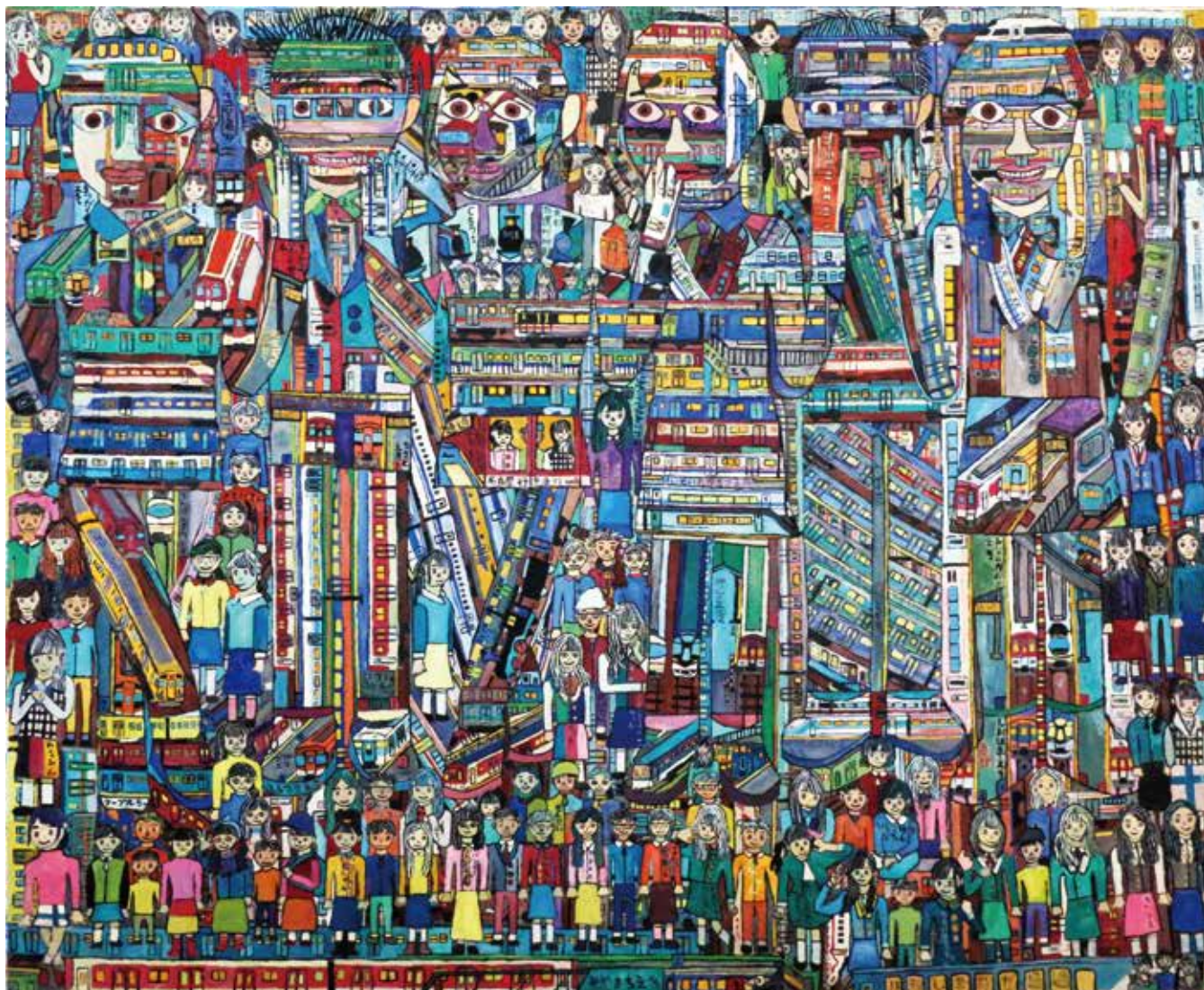
「通過電車でアイドル交流会」 早川 拓馬