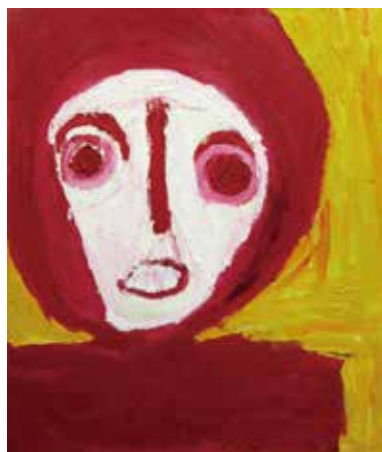
「赤い人」 川上 建次