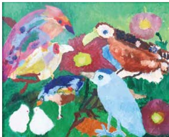
「仲間が家族」 ぼんまゐ