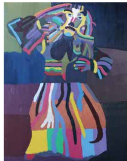
「ジャックリオン」 森 啓輔