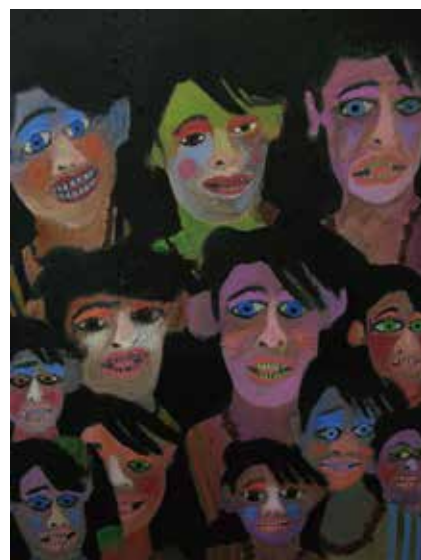
「この村の悲しみ」 横田 貴宏