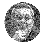
ふじ ひろ し 藤 浩志

障がいのある人の芸術活動に関わり、『日本財団DIVERSITY IN THE ARTS公募展』のアートディレクター、審査員を務めるなど広く活躍。NPO法人エイブル・アート・ジャパン理事、一般社団法人Get in touch理事、社会福祉法人アール・ド・ヴィーヴル理事。一般社団法人ArtInterMix代表。