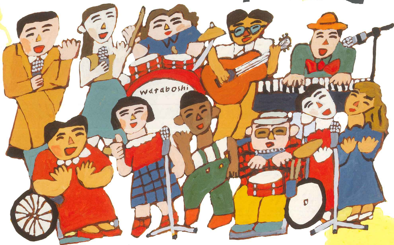
Illustration by HIRAMICHI SOTEN The Logo type by Nodoka Sazumura