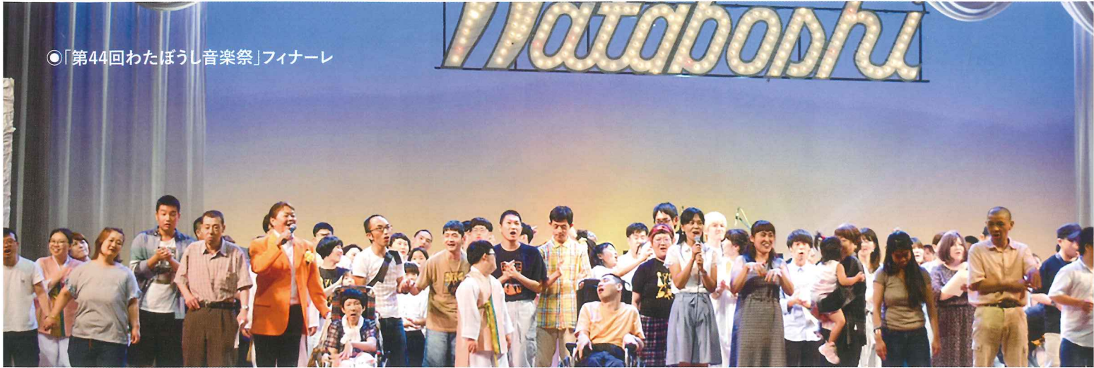
◎「第44回わたぼうし音楽祭」フィナーレ

障害のある人たちが書く詩は、生きることの喜びや哀しみ、いのちの尊さなどを歌っています。そこには大切なものを見失いがちな、今の社会へのメッセージがあふれています。