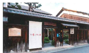
ボードレス・アートミュージアムNO-MA