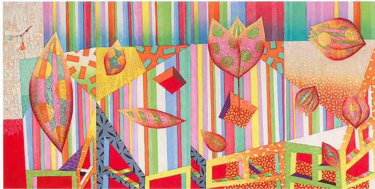
Still Life(6) 2011年/木版/60cm x 120cm