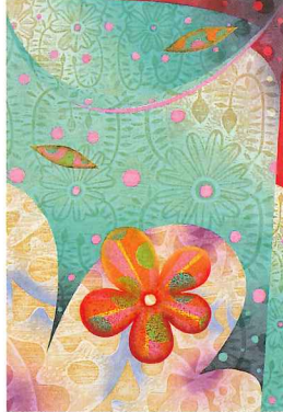
緑の絨毯とPlum 2018年/木版/87cm x 60cm