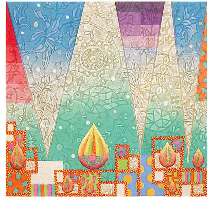
Asian-7つの栗- 2023年/木版/86cm x 90cm