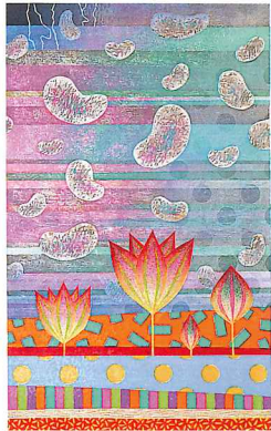
遠雷 (Lotus・地・水・SORA) 2020年/木版/92cm x 56cm