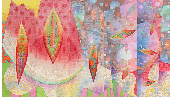
夏の果実 2014年/木版/87cm x 30cm x 5点