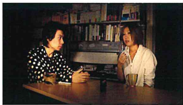
百瀬文《聞こえない木下さんに聞きたいいくつかのこと》2013 個人蔵