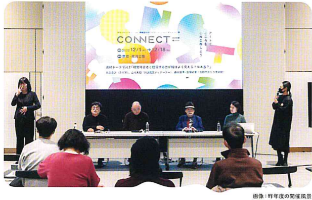
画像：昨年度の開催風景