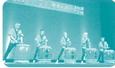
豊中ろう和太鼓クラブ「鼓響」