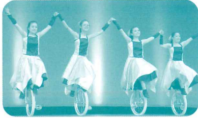
フェアリーテイル(堺鈴の宮一輪車クラブ)

さかいすず みやいちりんしゃ フェアリーテイル(堺鈴の宮一輪車クラブ) 2022年 パフォーマンス部門 グランプリ受賞 とよなか わ だいご こびき 豊中ろう和太鼓クラブ「鼓響」 2022年 音楽部門 グランプリ受賞 おおさか ふしょう しゃ ぶ たいげいじゅつ 大阪府障がい者舞台芸術オープンカレッジ2023(創造のコース) そうぞう