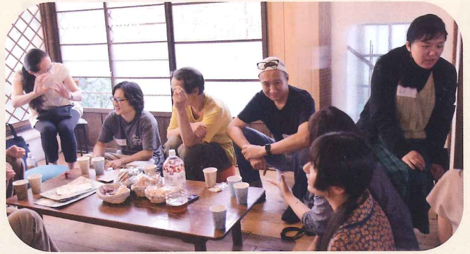
昨年度の実施の様子