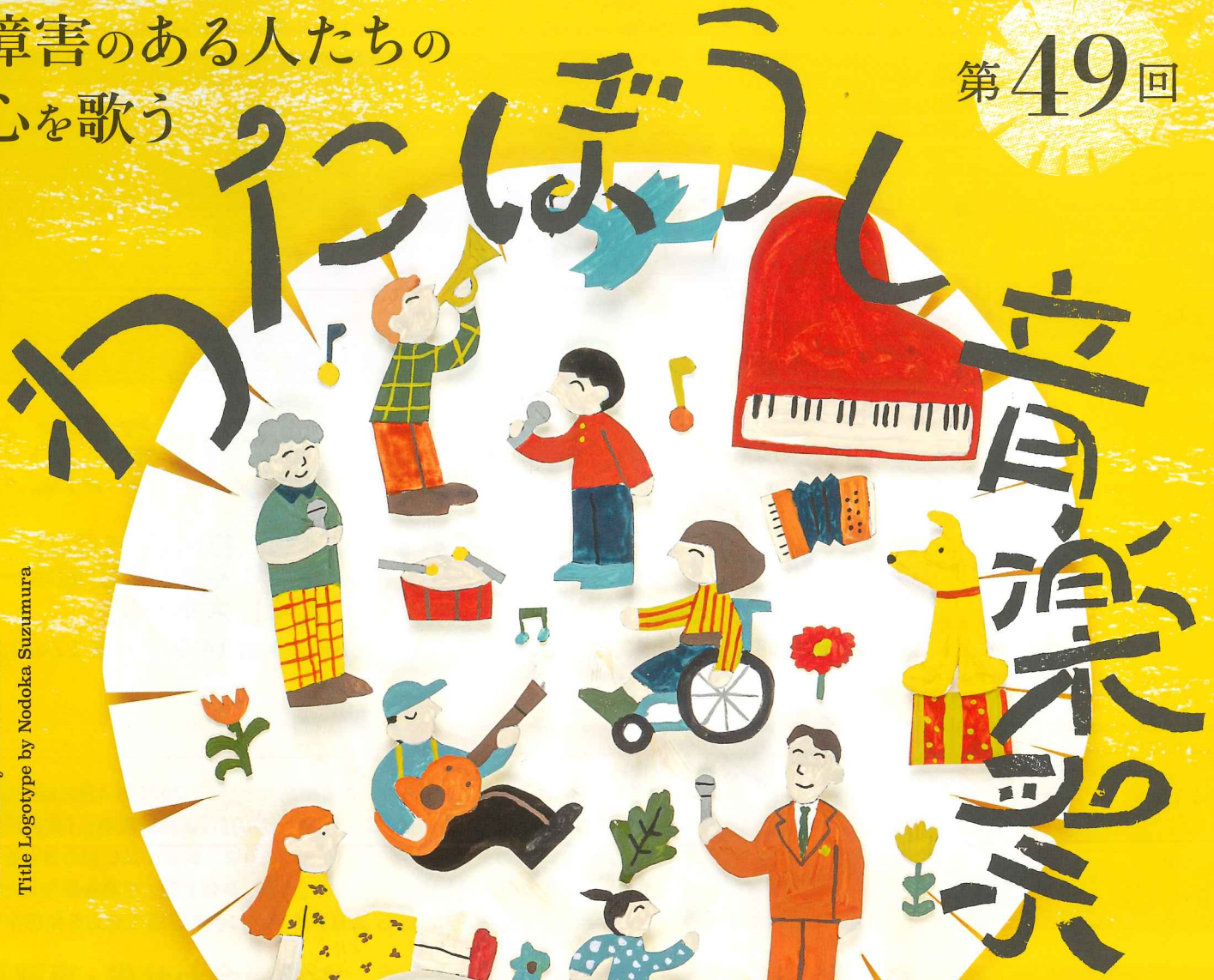
Illustration by Hinako Ouchi Title Logotype by Nodoka Suzumura