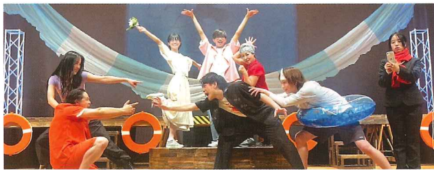
ゲスト出演「空の旅団」

「空の旅団」は、手話パフォーマンス演劇劇団として、2021年4月に結成しました。「翔(はばた)け空へ『表(ひょう)言(げん)』(『表』は「表現」、『言』は「言語」を意味する)の壁はない」をモットーに、ろう者と聴者が共に創る舞台を通して、共生社会の実現をめざしています。手話、身体表現、字幕を駆使した独自の手話パフォーマンス演劇で、奈良県を拠点に手話言語の魅力を発信中!