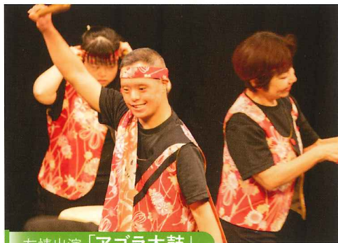
友情出演「アゴラ太鼓」

「空の旅団」は、手話パフォーマンス演劇劇団として、2021年4月に結成しました。「翔(はばた)け空へ『表(ひょう)言(げん)』(『表』は「表現」、『言』は「言語」を意味する)の壁はない」をモットーに、ろう者と聴者が共に創る舞台を通して、共生社会の実現をめざしています。手話、身体表現、字幕を駆使した独自の手話パフォーマンス演劇で、奈良県を拠点に手話言語の魅力を発信中!