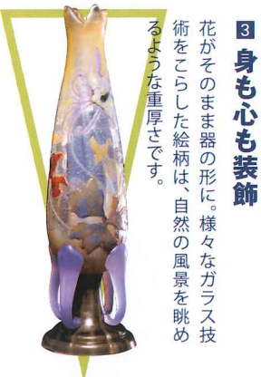
3 身も心も装飾 花がそのまま器の形に。様々なガラス技術をこらした絵柄は、自然の風景を眺めるような重厚さです。