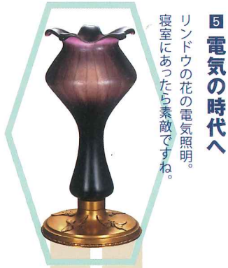
5 電気時代のへ リンドウの花の電気照明。寝室にあつたら素敵ですね。