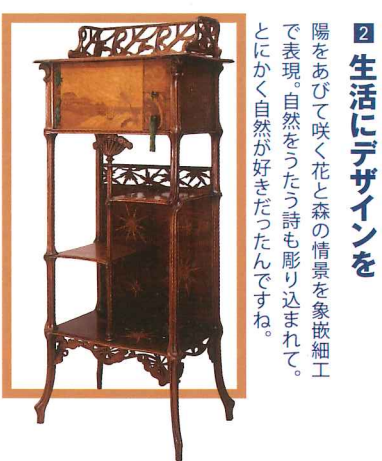
2 生活にデザインを 陽をあびて咲く花と森の情景を象嵌細工で表現。自然をうたう詩も彫り込まれて。とにかく自然が好きだったんですね。