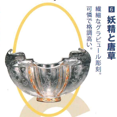
6 妖精と唐草 繊細なグラビユール彫刻。可憐で格調高い。