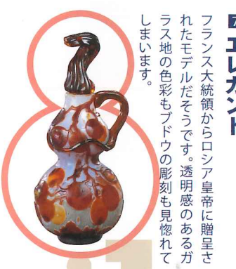
7 エレガント フランス大統領からロシア皇帝に贈呈されたモデルだそうです。透明感のあるガラス地の色彩もブドウの彫刻も見惚れてしまいます。