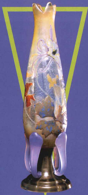
《花器 (オダマキ)》1898-1900年 ヤマザキマザック美術館蔵