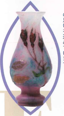
8 故郷への思い フランスのバラと呼ばれる逸品。普仏戦争の敗北により奪われた故郷ロレーヌへの思いを込めています。