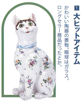
1 大ヒットアイテム かわい陶器の置物。眼球はガラス。ロングセラー商品だったとか。

園芸家としても知られ、自然美への憧憬と人間の魂の表現をガラス芸術に注ぐ一方、芸術とデザイン経営の狭間に激しく揺れ動いたガレの正直な生き方は、今日一層気になる存在です。自然との共生を模索し、人間社会の持続的な未来を願う現代の私たちに、大きな勇気とヒントを与えてくれることでしょう。自然豊かな文化の森の美術館で、ガレの美への情熱との出合いをたくさんの方に体験していただけることを願ってやみません。