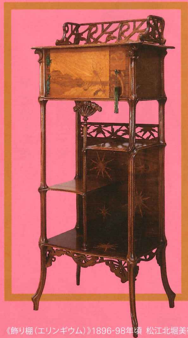
《飾り棚 (エリンギウム)》1896-98年頃 松江北堀美術館蔵