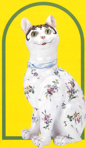
《猫型置物》1865-90年代 松江北堀美術館蔵