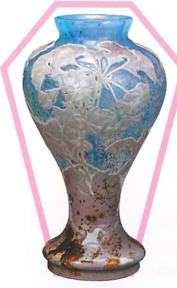
4 ガレ独壇場 何層も重ねたガラス地に古色を加えた幻想的な背景。彫刻の立体感にこだわり、植物の生命力を感じさせる演出は、まさにガレの真骨頂。