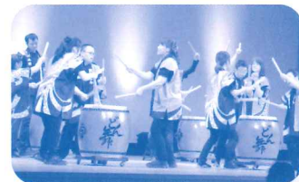
和太鼓サークル どん舞