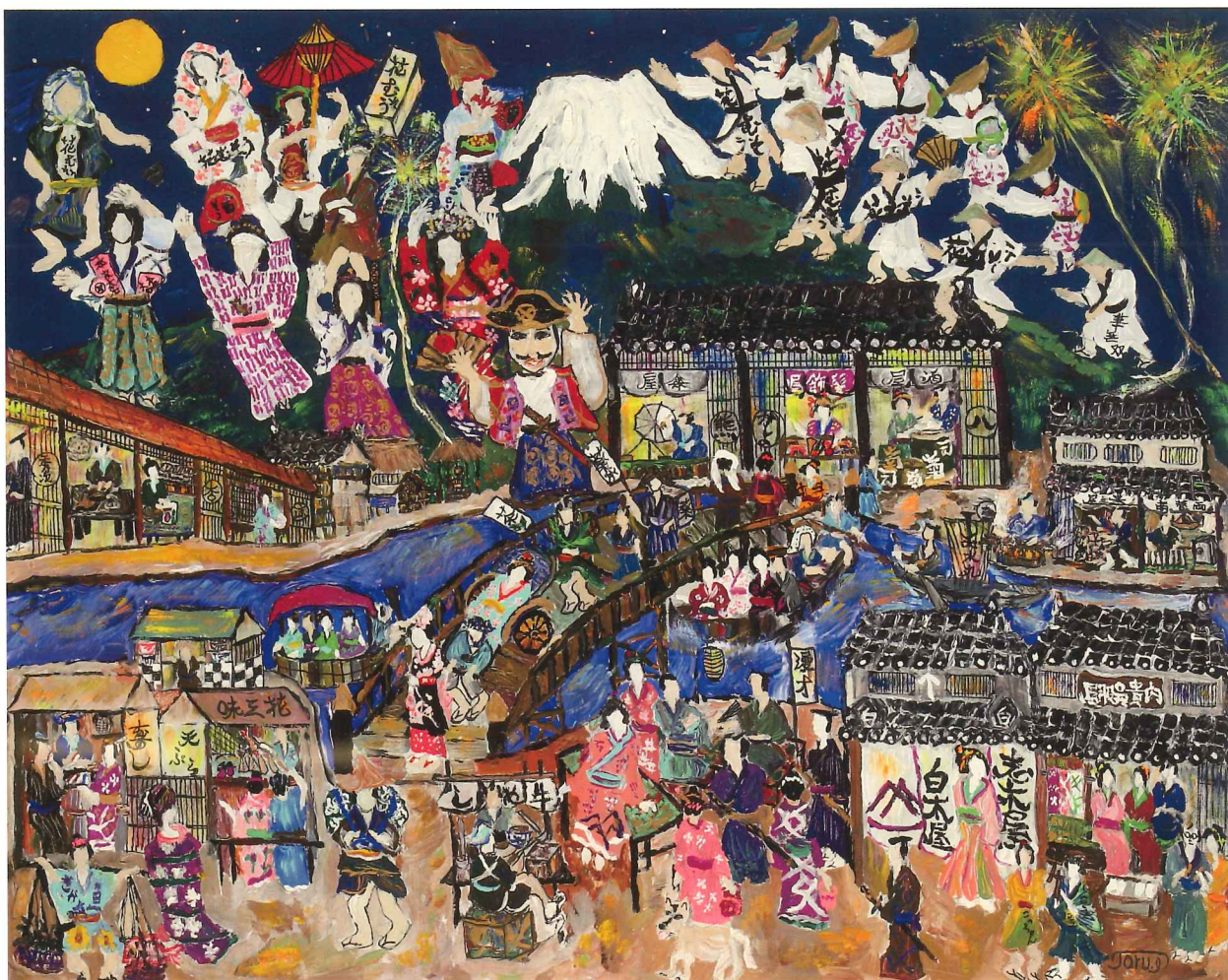
乾 徹 INUI Toru 「富士山と江戸時代の庶民の暮らし(阿波踊り)」

日々の暮らしの中で湧き上がる思いを紡いだそれぞれのストーリー 10人の創る10の世界