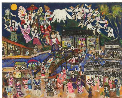
乾 徹 INUI Toru 「富士山と江戸時代の庶民の暮らし(阿波踊り)」