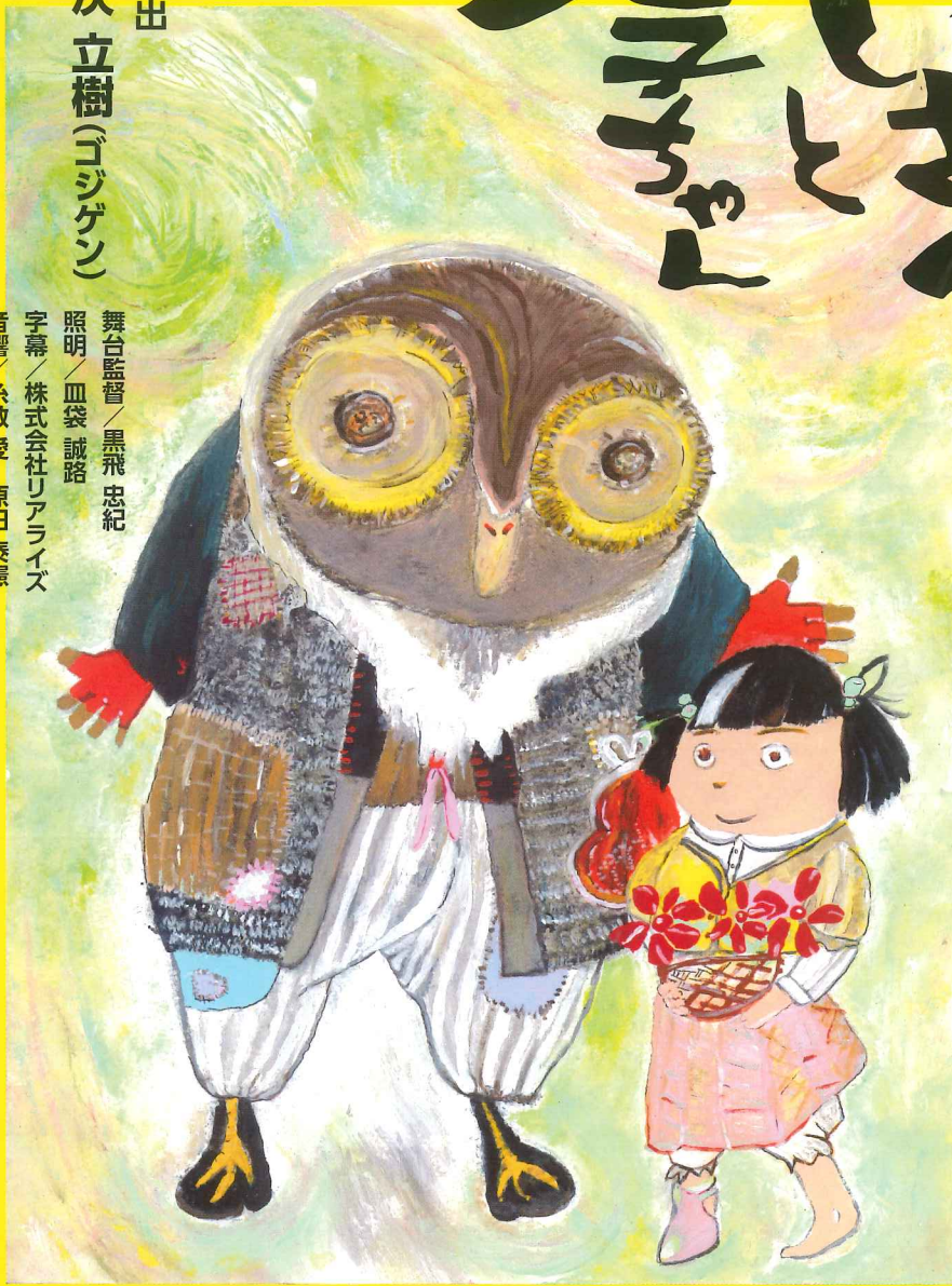
イラスト 倉持智行