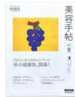
(株)ハーバー研究所/ 美容手帖