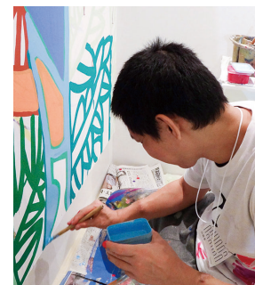
rooms/ ライブペインティング