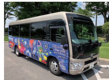
トヨタ自動車(株)/ ラッピングバス