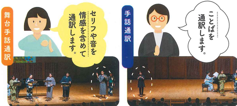
舞台手話通訳 / 福岡ろう劇団博多

舞台から発信される「音の情報」を手話で伝える通訳です。歌詞の内容だけでなく、リズムや抑揚も含めた舞台全体の雰囲気を表現します。